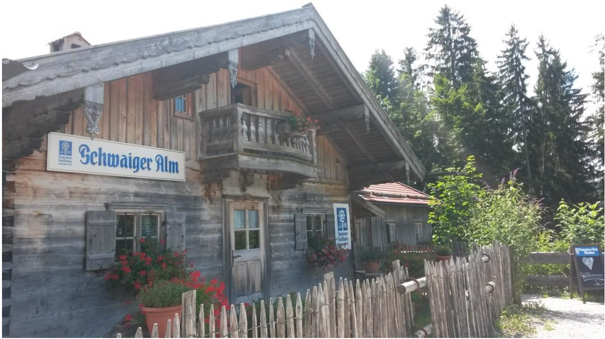
Die gemütliche Schwaiger Alm...

...nur 10 Gehminuten vom Parkplatz des Winklstüberls weg